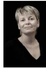
Rachel CHALOPIN Photographe professionnel

Amateurs de treks et de randonnées à ski dans le Grand Nord en autonomie totale, notre attirance pour les grands espaces nous a conduit à maintes reprises dans les contrées boréales (Islande, Groenland, Norvège, Suède, Nunavut...) où nous pouvons assouvir notre recherche d'immensité.